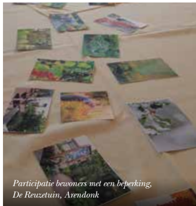
Participatie bewoners met een beperking, De Reuzetuin, Arendonk

Uit verschillende studies blijkt veiligheid de grootste bezorgdheid te zijn van ouderen en andere kwetsbare groepen. Dit beperkt hen bij dagelijkse activiteiten en bij lichaamsbeweging. Veiligheid omvat zowel omgevingskenmerken in verband met fysieke veiligheid, als de sociale perceptie van een veilig gevoel.