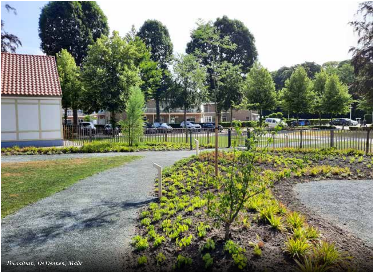
Dwaaltuin, De Dennen, Malle