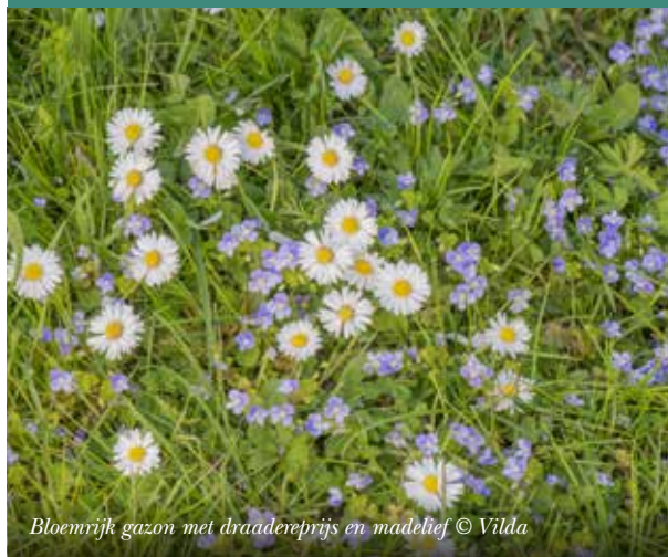
Bloemrijk gazon met draadereprijs en madelief

Mensen met dementie onthouden moeilijk recente gebeurtenissen maar houden ervan om te vertellen over vroeger. Ga samen op stap in hun herinneringen door met oude materialen, weerspreuken of de juiste beplanting hun zintuigen te prikkelen. Door planten zoals boerenhortensia, vlier, stinkertjes, lampionplant, Franse geranium, boerenjasmijn, dahlia, sering, rabarber of kruisbes komen de herinneringen naar boven.