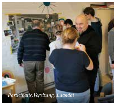
Participatie, Vogelzang, Laakdal

De vragen zijn eenduidig en gemakkelijk te beantwoorden. Het taalgebruik is aangepast aan de leefwereld van de doelgroep. Werk ook met foto's tijdens de dialoogsprekken, die dienen als visuele ondersteuning of als inspiratie.