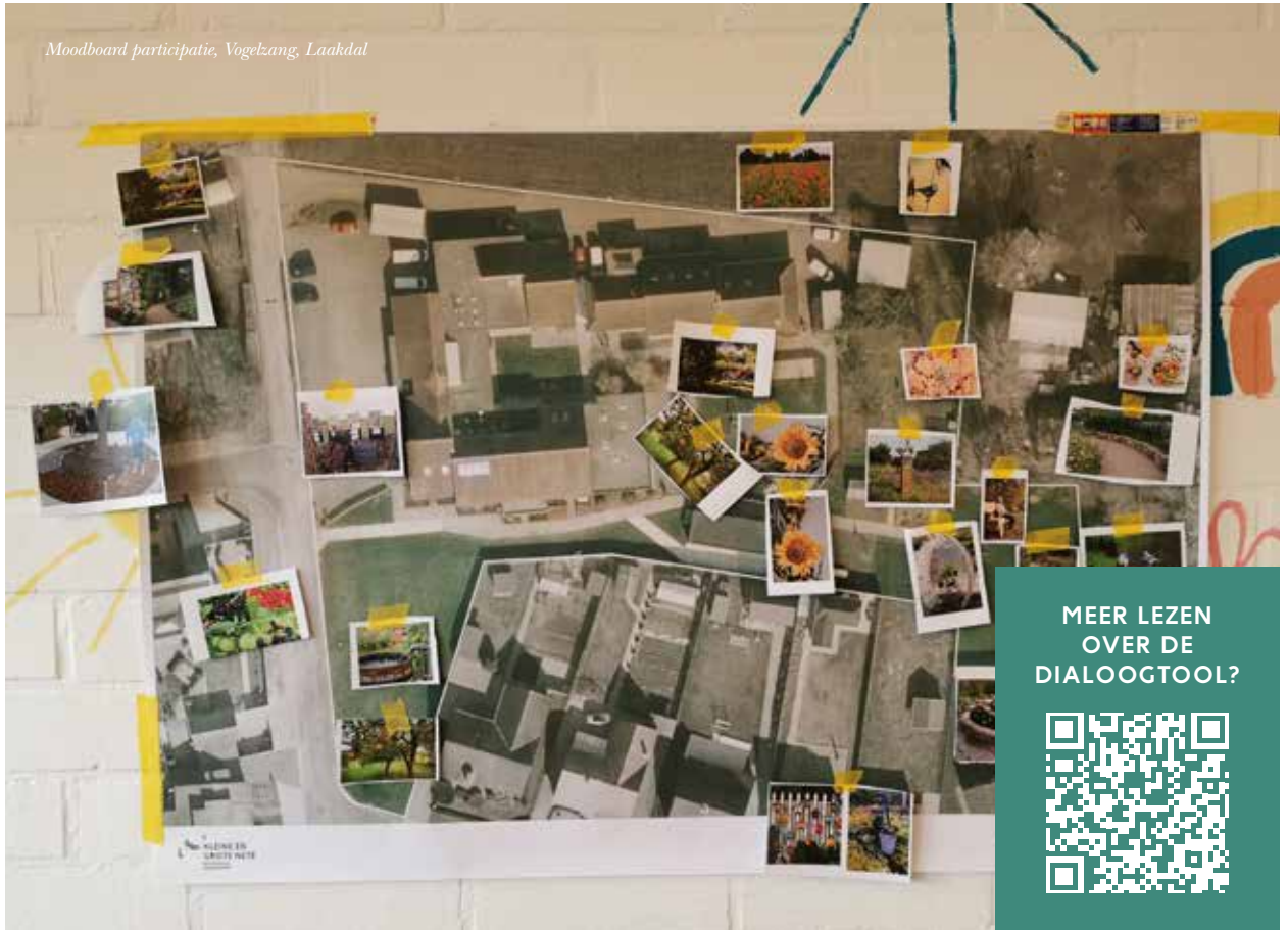
Moodboard participatie, Vogelzang, Laakdal