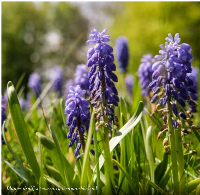
Blauwe druifjes (muscari), voorjaarsbloeiend

Streekeigen planten zorgen voor een grote herkenbaarheid bij sommige generaties bewoners. Maar ze zorgen ook voor de integratie in het landschap en verhogen de natuurwaarden.