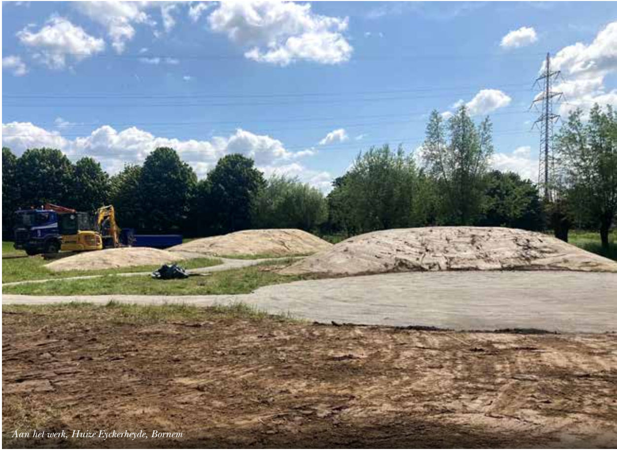
Aan het werk, Huize Eyckerheyde, Bornem