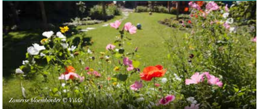
Zomerse bloemborder