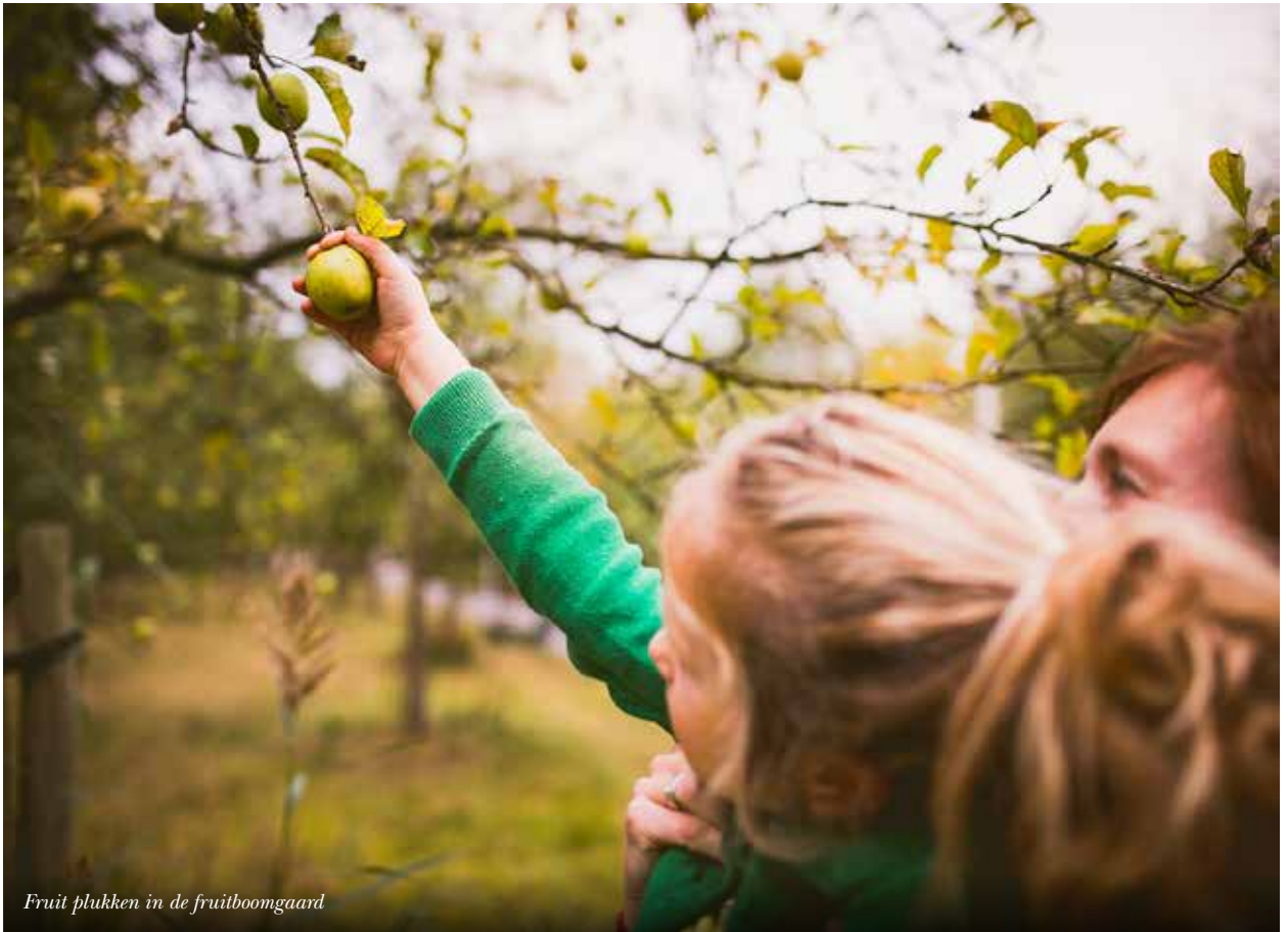
Fruit plukken in de fruitboomgaard