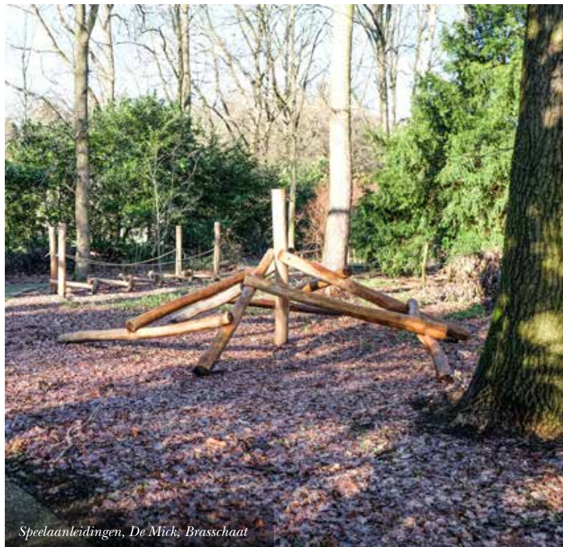
Speelaanleidingen, De Mick, Brasschaat

Voorzie ruimte voor groepsactiviteiten zoals kub of petanque. Een multifunctioneel grasveld is de ideale plek voor spontane activiteiten.