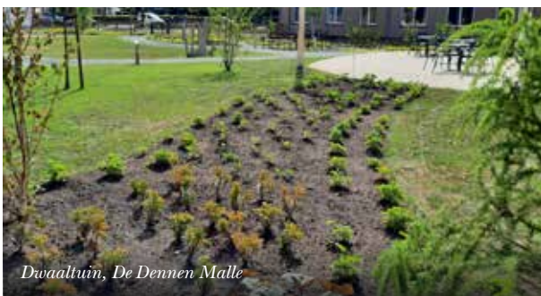
Dwaaltuin, De Dennen Malle

Voorzie ook ruimte voor stilte, rust en bezinning. Denk aan een beschutte plek of een luwteplek in de tuin, ingericht met kunst of beelden die een meerwaarde kunnen zijn voor zingeving.