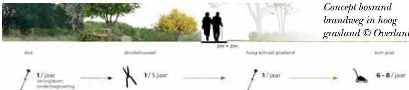
Concept bosrand brandweg in hoog grasland

Het plantseizoen is tussen november en maart. Organiseer plantdagen met bewoners, bezoekers, buurtbewoners, school of vrijwilligers. Zo creëer je betrokkenheid bij de zorgtuin en kan je kosten drukken.