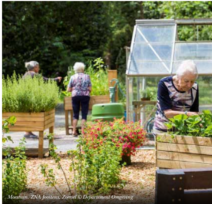
Moestuin, ZNA Joostens, Zoersel

Meer info over tuinieren en gemakstuinieren lees je in het Werkboek Gemakstuinen van de stichting Van Swietentuin of op http://vanswientuin.nl/de-tuin/