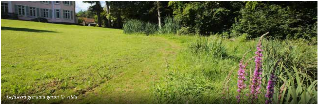
Gefaseerd gemaaid gazon