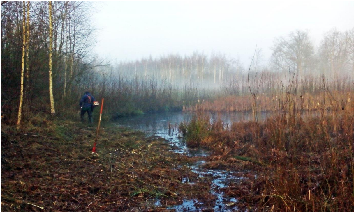
Natuurwerk maakt de poelen aan de Koulaak opnieuw zichtbaar in het landschap.

Vanuit de stad kan je via de Kleine Nete doorsteken naar de Kempense Heuvelrug of het Olens Broek voor uren wandelplezier. Maak je deze wandeling, passeer je langs een vijftal poelen aan de Koulaak. De poelen werden eveneens in kader van landschapsherstel door het landschapsteam van regionaal landschap vrijgemaakt.