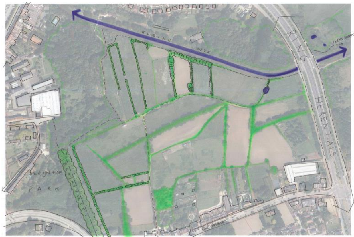
Werken aan heggen en houtkanten in de Hellekens